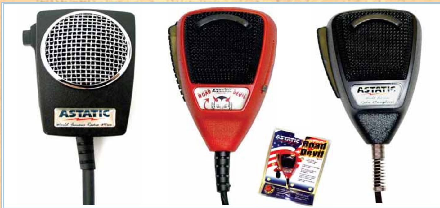
D104M6B - CERAMIC POWER