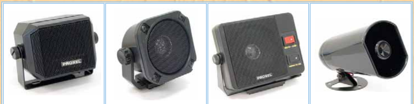
SP-300 Altoparlante rettangolare con staffa, 80x65x55 - 8ohm 3/5W