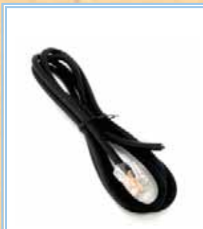
AV-73 (in dotazione) Universale