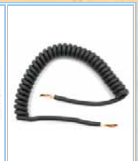
MC6-10 Cavo microfonico di ricambio 6 poli

Tutti i marchi presenti in questo catalogo sono di proprietà dei rispettivi possessori