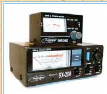
Rosmetri/Wattmetri Citizen Band