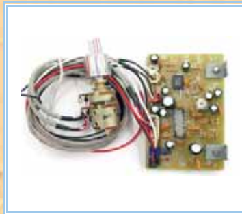
Schede Echo e Beep