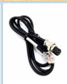
AV-24 (accessorio) Kenwood, Yaesu, Icom, RJ45-8 Pin