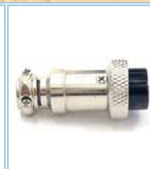
Connettore Volante a 4pin (C4), 5pin (C5), 6pin (C6) e 8pin (C8)