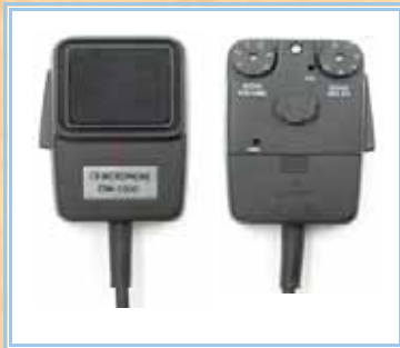
Microfoni da Palmo

Microfoni - Altoparlanti - Frequenzimetri - Alimentatori