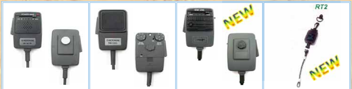
DM-453RK / DM-453RKM Microfono PREAMPLIFICATO reg., batt. 9V, conn. "President" e "Alan" 4 poli