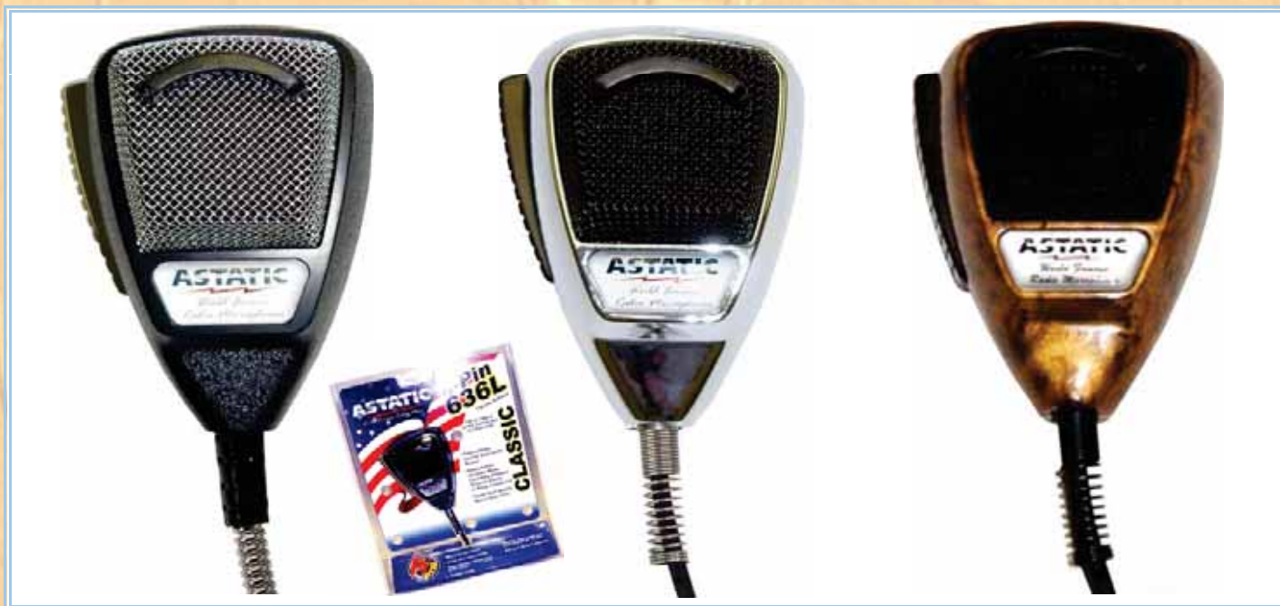
636L-SE - SILVER NOISE CANCELLING