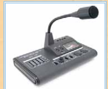
Microfoni da Tavolo