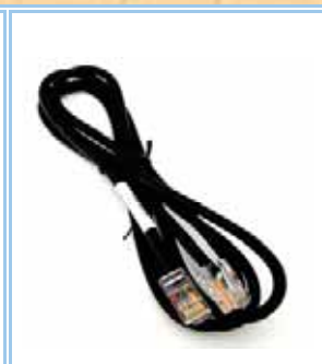
AV-73 (accessorio) Kenwood, Yaesu, Icom, RJ45-RJ45