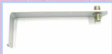
PSA-20PL - PSA-20N

Staffe appositamente studiate e realizzate per l'impiego con le antenne per sicurezza. Sono disponibili con connettore N o PL e nelle lunghezze di 20cm e 42cm