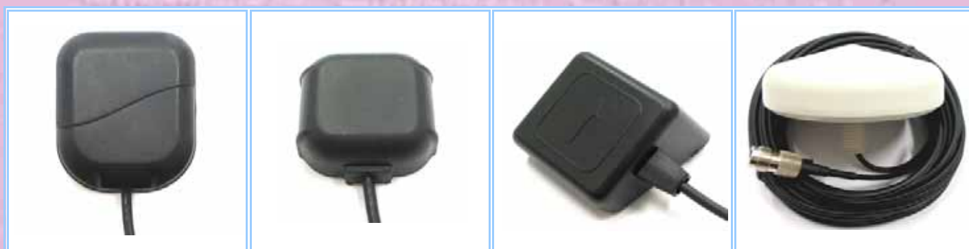
GPS-MCX GPSMMCX GPS-SMA GPS-SMB/F