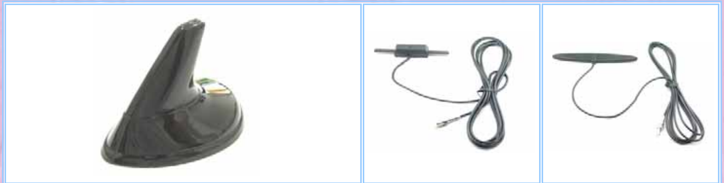
PROX-SHARK1 - PROX-SHARK2 - PROX-SHARK3