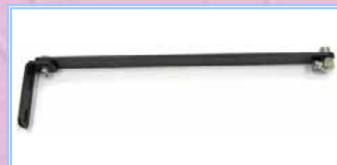
PSA-42PL - PSA-42N

Staffe appositamente studiate e realizzate per l'impiego con le antenne per sicurezza. Sono disponibili con connettore N o PL e nelle lunghezze di 20cm e 42cm